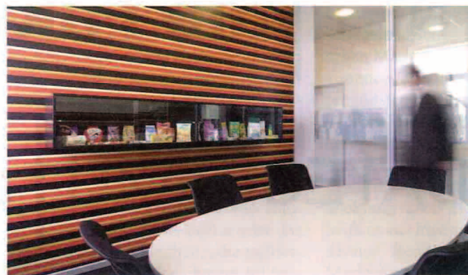
Besprechungsraum: Zimmer Mars präsentiert die ganze Produktivität.

Pausen sind ambivalent. Sie dienen der Ruhe, aber auch dem fachlichen oder informellen Gespräch. Gerade im Büroalltag werden sie individuell wahrgenommen. Zu diesem Ergebnis kommt eine Studie, die Mars im Jahr 2006 branchenübergreifend unter deutschen Personalentscheidern durchführte. Dem Ergebnis wurde Rechnung getragen.