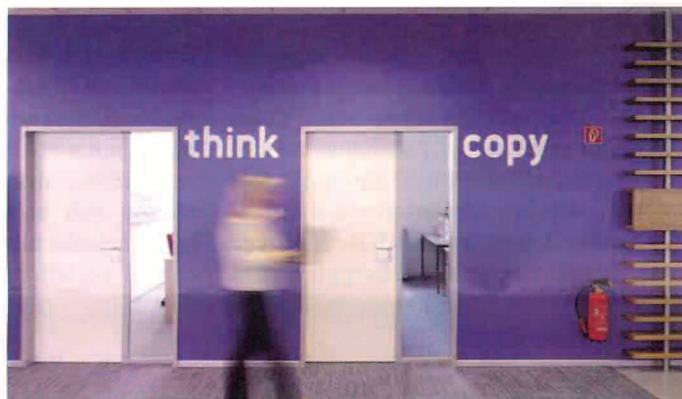
Denkpausen: Im Think Tank wird nachgedacht und nebenan kopiert.

Pausen sind ambivalent. Sie dienen der Ruhe, aber auch dem fachlichen oder informellen Gespräch. Gerade im Büroalltag werden sie individuell wahrgenommen. Zu diesem Ergebnis kommt eine Studie, die Mars im Jahr 2006 branchenübergreifend unter deutschen Personalentscheidern durchführte. Dem Ergebnis wurde Rechnung getragen.