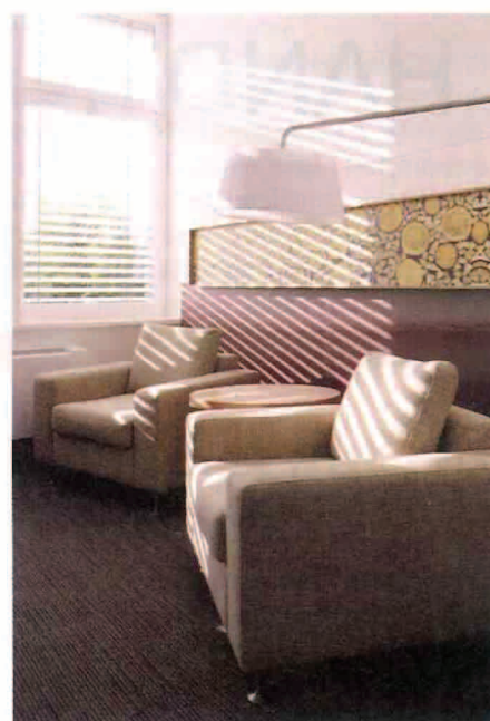
Kaminzimmer: Personalgespräche in privater Atmosphäre.

ist eine Bibliothek zugeordnet – ausgestattet mit Fachliteratur und Tageszeitungen. Dort wird nicht nur gelesen, sondern via MP3-Player auch Musik gehört. Von dieser Unit Area aus führt der Weg zu verschiedenen Ruhe-, Entspannungs- und Besprechungsräumen.